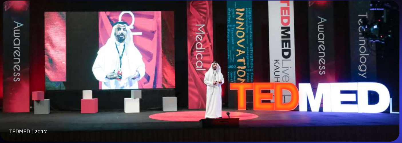
TEDMED | 2017