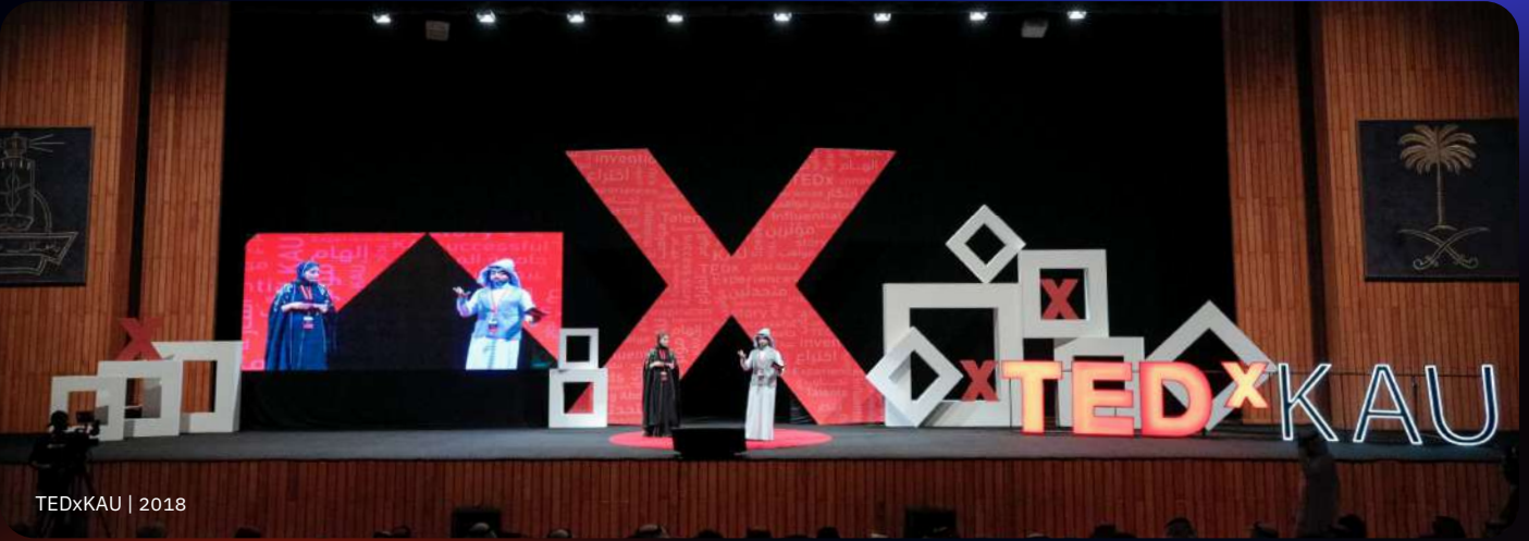
TEDxKAU | 2018