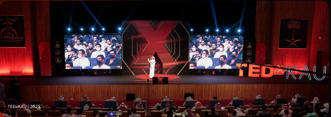
TEDxKAU | 2021